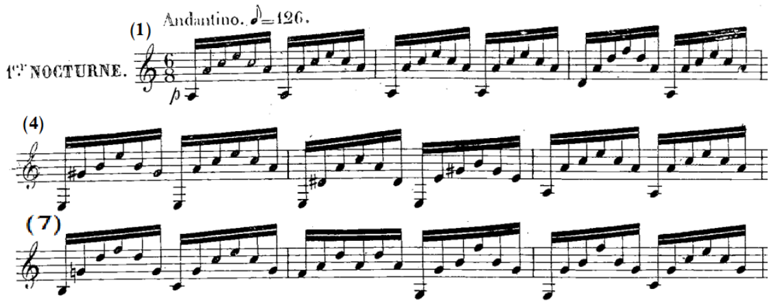
شكل رقم (ب-١)

الجملة الأولى بالفكرة الأولى A من م(١)- (٩) عند الفيولينة