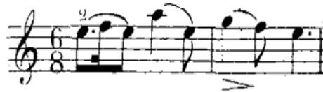
شكل رقم (١٩)

- في م(٦)، (٧) وإعادتهما في م(٣٨)، (٣٩).