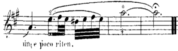
شكل رقم (١٧)