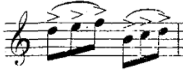
شكل رقم (٦)

العزف، والمحافظة على ضغط شعر القوس على الوتر، وخاصة في إستعمال القوس في الإتجاهين الهابط والصاعد، يجب المحافظة على حجم الجزء المستعمل من القوس حتى لا تتغير نوعية الصوت، كما يجب المحافظة على درجة الصوت أثناء الأداء في الجزء الأسفل وعند كعب القوس لصعوبة السيطرة على توازن القوس في هذه المنطقة، وأحياناً في بعض الأعمال توضع علامة (>) ويقصد بها الضغط في بداية الصوت، أو علامة (-) وتعني التأكيد عليها وإظهارها وينتج عنها صوت العزف المنفصل (١) ، وظهر العزف المنفصل في النوكتورن كما يلي: - في م (٨) وإعادتها في م (٤٠).