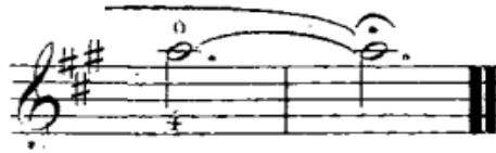
شكل رقم (٢٨) الفلاوتاتو في م (٦٧)

المصطلحات التعبيرية والأدائية: والجدول التالي يوضح ذلك.