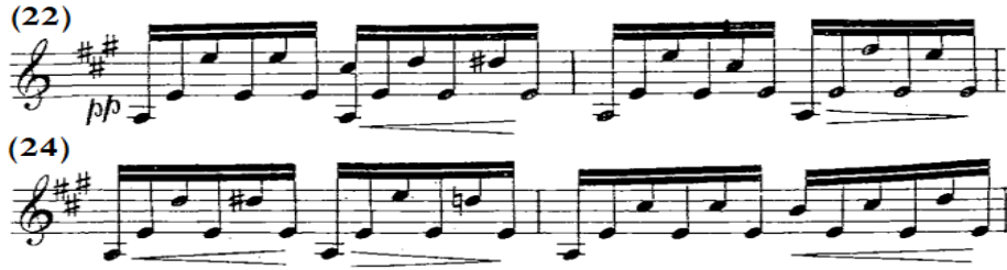
شكل رقم (٣-ب)

العبرة الأولى بالفكرة الثانية B من م(٢٢)- (٢٥) عند الجيتار