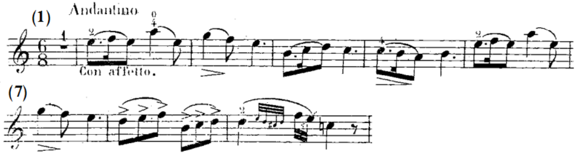
شكل رقم (أ-١)

الجملة الأولى بالفكرة الأولى A من م(١)- (٩) عند الفيولينة