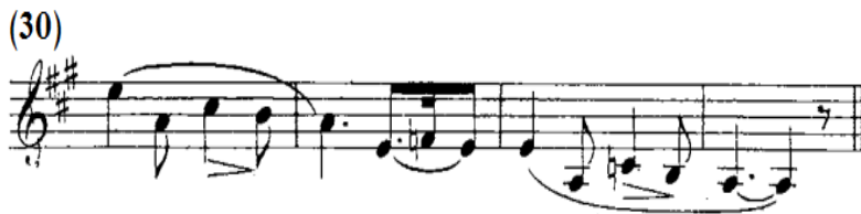
شكل رقم (٥-أ)