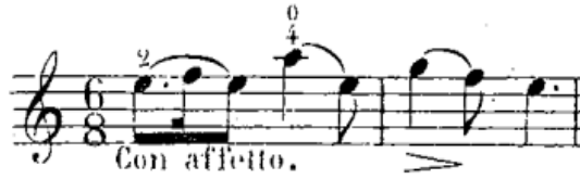
شكل رقم (١٨)

- في م(٢)، (٣) وإعادتهما في م(٣٤)، (٣٥).