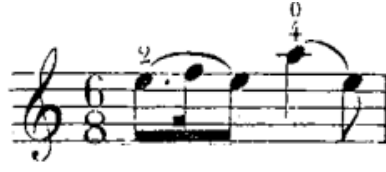
شكل رقم (٢٦) الفلاوتاتو في م (٢)