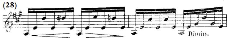
شكل رقم (٤-ب)

العبرة الثانية بالفكرة الثانية B من م(٢٦)- (٢٩) عند الجيتار