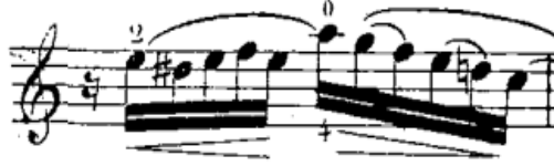
شكل رقم (٢٧) الفلاوتاتو في م (١١)