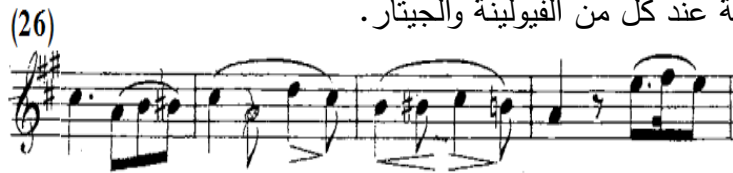
شكل رقم (٤-أ)

الثانية بالفكرة الثانية عند كل من الفيولينة والجيتار.