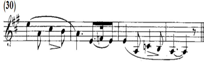
شكل رقم (١٦)